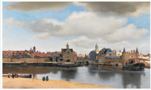
Gezicht op Delft Johannes Vermeer (1632-1675)

uit de 19 e eeuw. Ook de orgelmuziek uit die tijd zou je overwegend donkerbruin kunnen noemen. Die donkere kleur is nog niet helemaal te horen in de Praeludium van Rinck. Dit is een licht bruin orgelstuk, met nog hier en daar een licht gekleurd trillertje en een tierelantijntje. Na het openingsfragment verschijnt ineens, en dit is toevallig, een fragment uit het Kerstlied “Eer zij God in onze dagen”. Echt donkerbruin is het Praeludium van Czerney. Het stuk opent met dikke, vette, zware akkoorden. Ook de Fuga houdt het op donkere kleuren. Czerney is beroemd en berucht bij pianoleerlingen door zijn honderden Etudes (vingeroefeningen) voor piano. Helemaal donkerbruin, bijna somber, is het begin van de Praeludium van Whiting. Het middendeel staat in majeur en is lichter van kleur. De rechterhand speelt lichte stijgende, opgewekte toonladder figuurtjes met heldere fluiten. De Postludio van Karg-Elert is ook donker gekleurd maar heeft toch een licht, Festivo (feestelijk) tintje. Terug naar de cryptogram. Weet u de oplossing?